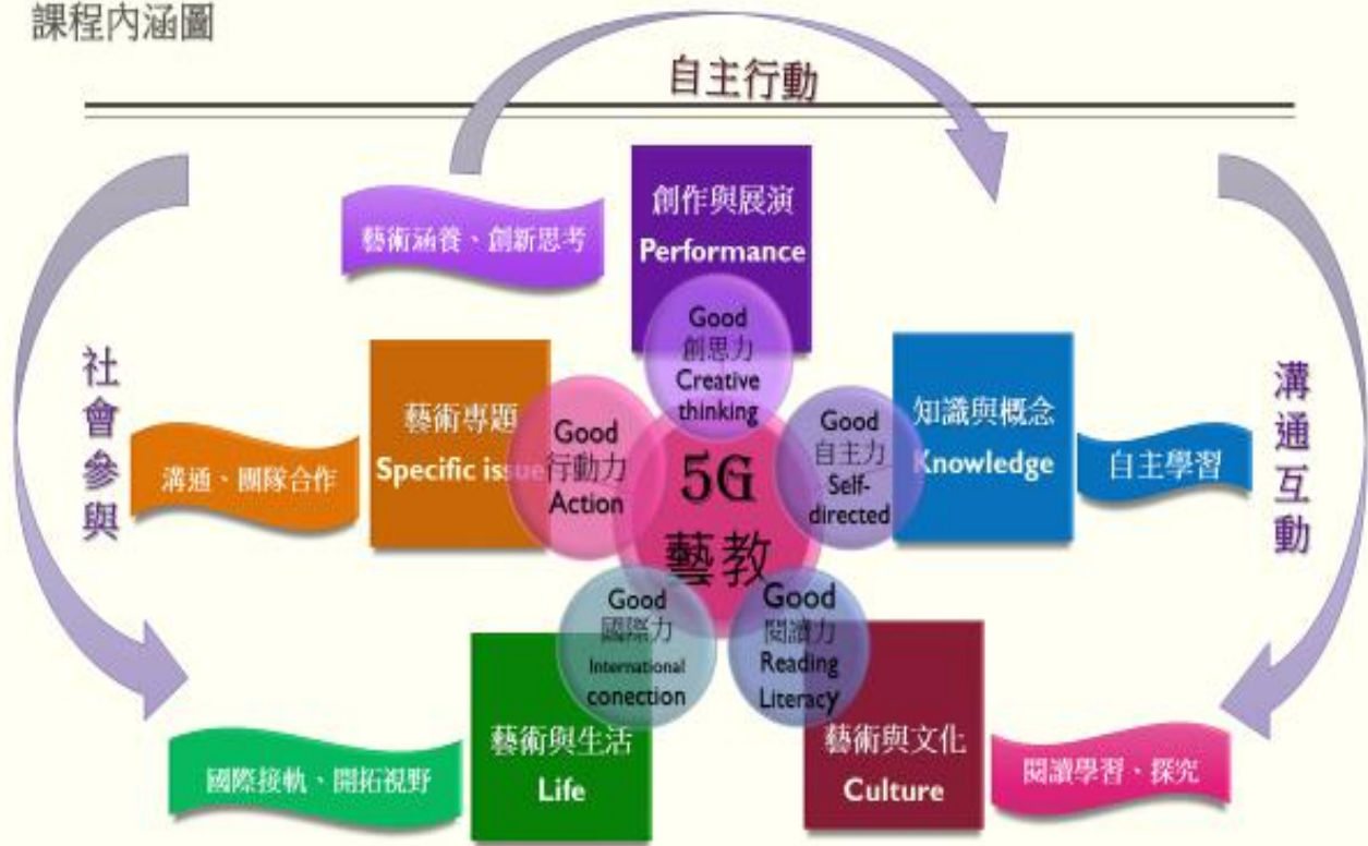
育英舞蹈班課程內涵圖